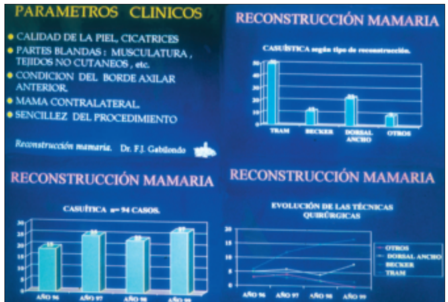
Figura 2: Nuestra casuística en datos por años, técnicas y evolución de indicaciones, así como los parámetros clínicos observados en las indicaciones.

Entre los años 1996 a 1999 hemos tratado más de un centenar de pacientes, de las que 94 son las que han completado todo el estudio y fueron controladas en las complicaciones. Para las indicaciones de forma personalizada, teníamos en cuenta los parámetros que ya hemos citado que analizan en componentes la simetría: Volumen, Forma, Complejo A-P, Reborde Axilar y Surco Submamario-Ptosis. Con estos cinco elementos imitaremos la mama contralateral o su resultado definitivo si la modificamos, para lo cual como mostramos en la figura 1 trasladamos la cicatriz sobre la mama contralateral y calculamos el defecto a reponer en volumen-forma, raqueta de piel y situación del surco submamario y pliegue axilar, lo que podemos luego proyectar en la Z.D. del colgajo escogido (en la imagen con el abdominal tipo TRAM) antes de levantarlo quirúrgicamente. El complejo areola-pezones