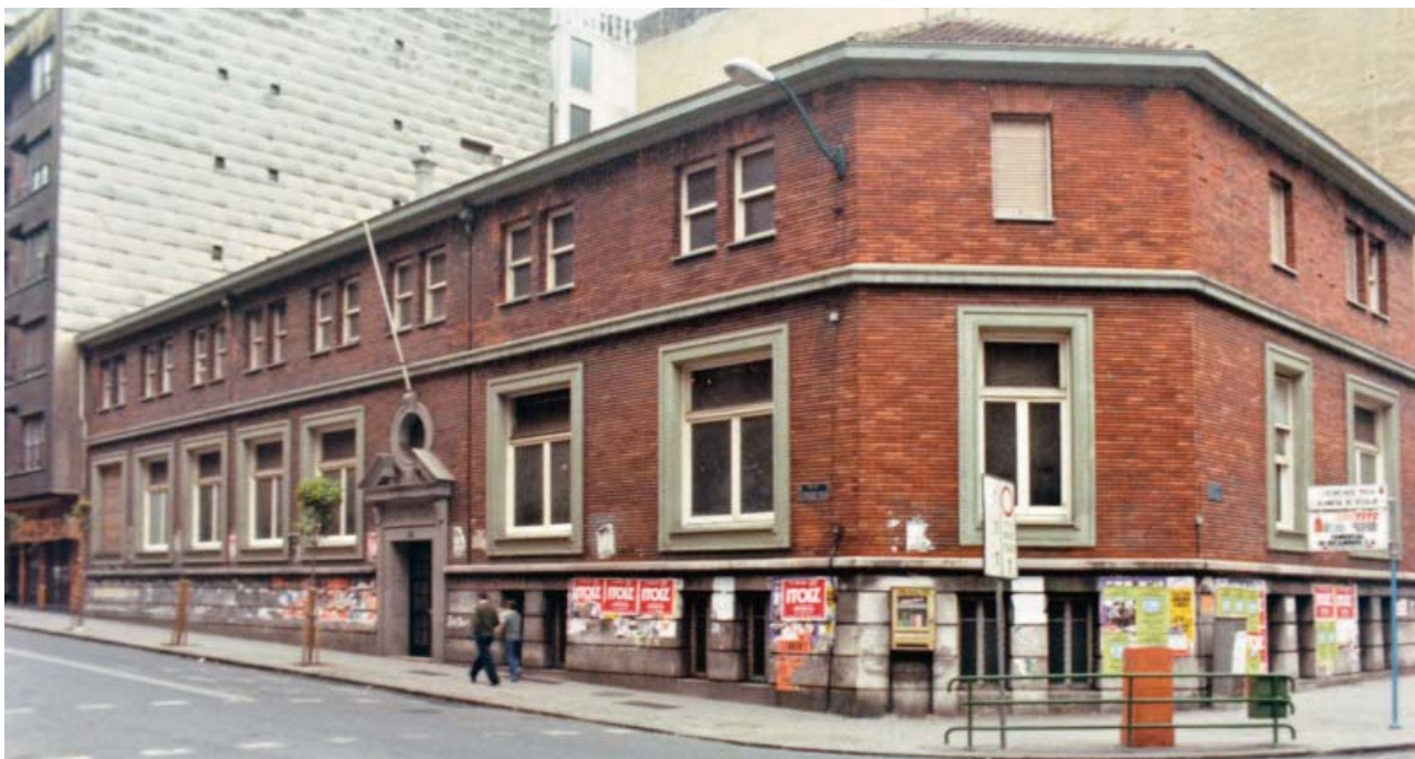
Figura 2. Imagen del antiguo dispensario de Ledo-Arteche, en Bilbao.

origen hasta la situación actual de este grave problema sanitario. A continuación se exponen los capítulos y los autores (Tabla I):